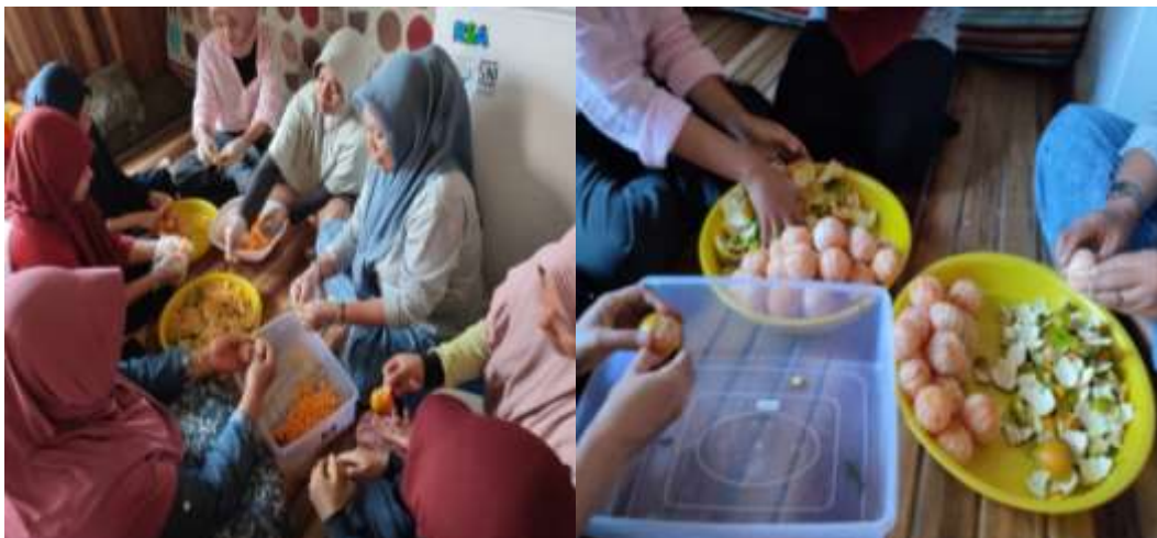
Gambar 2. Ibu-ibu PKK sedang antusias mengikuti pelatihan

Mitra memiliki pengetahuan tentang cara pengolahan jeruk sortir menjadi produk makanan. Dengan kegiatan ini mitra memiliki pengetahuan untuk dapat mengolah jeruk sortir yang ada disekitar kebun jeruk warga menjadi produk makanan dengan nilai ekonomi cukup tinggi, yaitu berupa dodol, manisan dan teh.