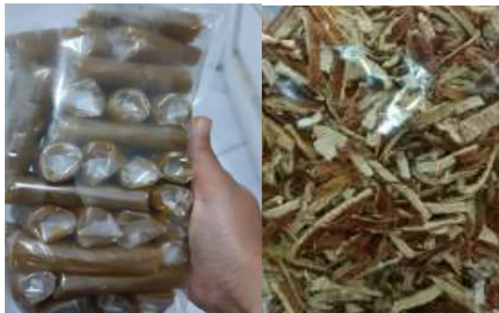
Gambar 4. Produk yang dihasilkan dari kegiatan pengabdian

Melalui kegiatan pengabdian ini, berhasil dihasilkan produk berupa dodol, manisan, dan teh yang terbuat dari jeruk sortir yang diperoleh dari perkebunan jeruk milik warga. Produk-produk tersebut merupakan hasil dari pelatihan pembuatan dan pemasaran olahan jeruk sortir yang diberikan kepada mitra. Diharapkan produk-produk tersebut dapat meningkatkan nilai tambah jeruk serta memberikan manfaat ekonomi bagi masyarakat setempat.